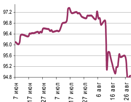
Индекс рубля к корзине валют (0,55 $, 0,45 €)