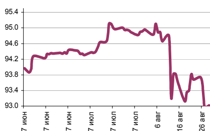
Индекс рубля к корзине валют (50% $, 50% €)